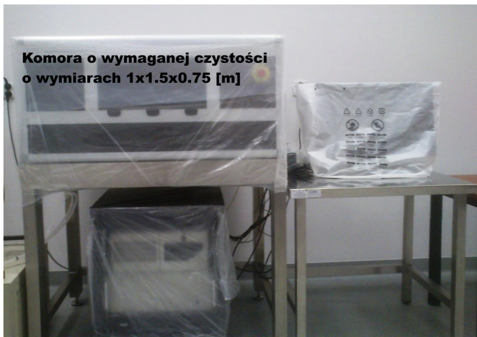
Rys.2. Fotografia urządzenia do fotolitografii